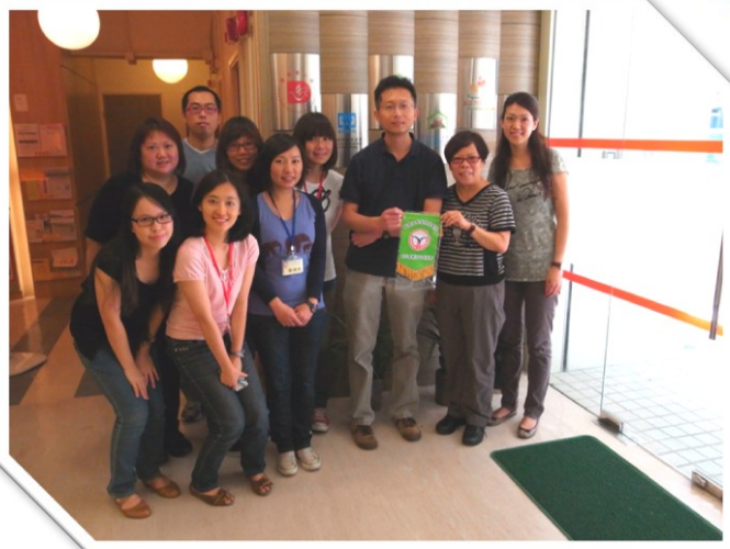
當日超過廿多位醫護人員來到中心與我們交流。