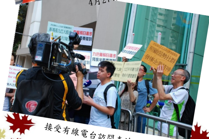
接受有線電台訪問表達訴求