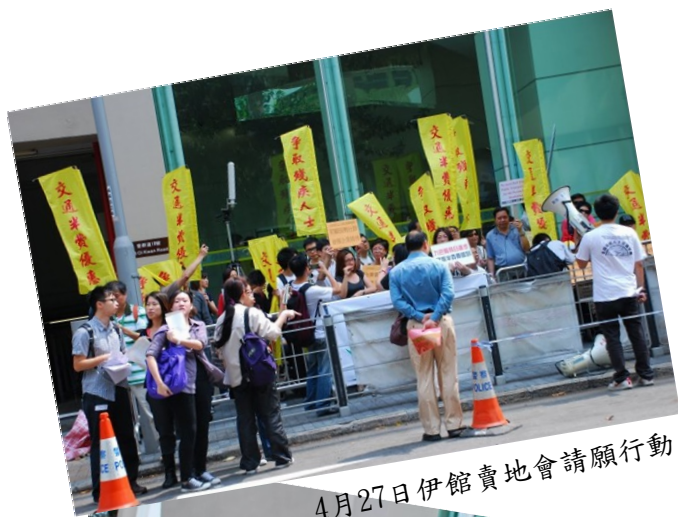
4月27日伊館賣地會請願行動

** 信件發出之後，八月中獲得運房局邀請會面，將於十月中再度(新一年立法會開會前)進行半費的會議。