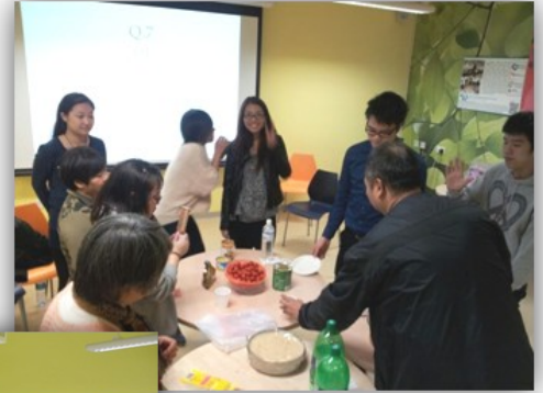
在最後一堂大家分享美食。