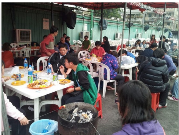
環境舒適，豐富美食。