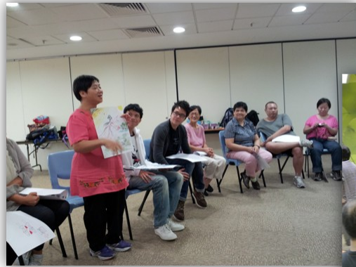
從繪畫中分享自己的感受。

超過 15 位會員參與此活動課程。多謝城大「城青優權計劃」的一班學生義工。他們很用心製作出不同遊戲和短劇，從歡樂氣氛中讓精盟會員學習到如何訂立目標的方法和技巧，以致達成課程的目標果效。