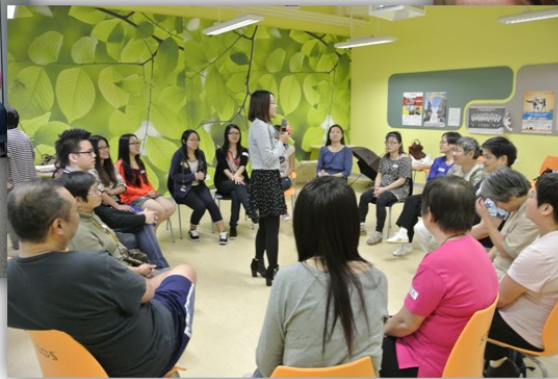
學生義工帶領課程。