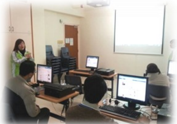
導師很悉心地教導。