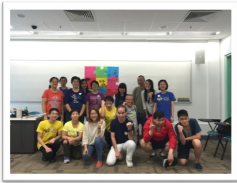
與香港城市大學的城青優權計劃合作，為期5堂「玩轉快樂人生」