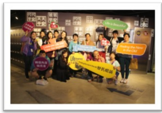
與城大同學仔一起參觀「生命歷程體驗館」