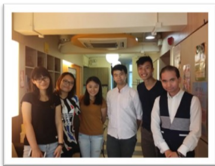
10/30 精盟接受明愛專上學院社會工作學系學生訪問