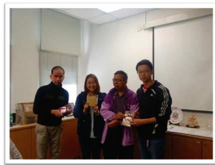
11/28 東華三院邀請精盟分享「康復者如何面對社會標籤」