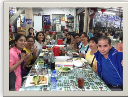
5/20 城青優權計劃同學仔與會員們重聚日