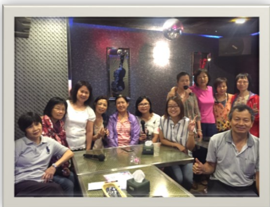
6/7 第八屆夏日慶端午卡拉 OK