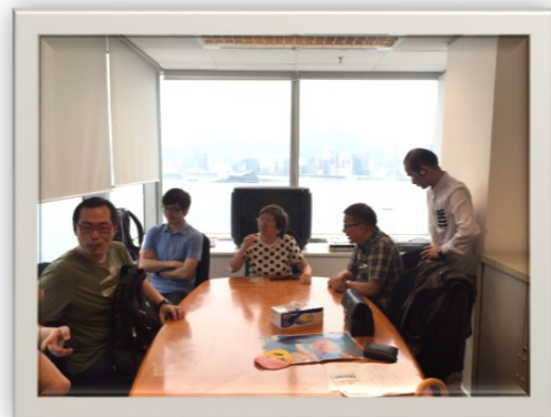
5/4 精盟聯同推動精神健康政策聯席的其他成員，向平機會投訴屈穎研言論歧視康復者