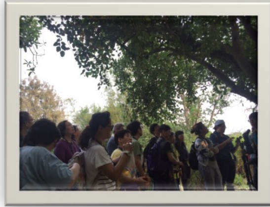
4/16 元朗米埔自然遊 感謝活動當日阿達義工的幫忙