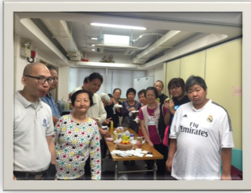
4/27 3、4、5 生日會