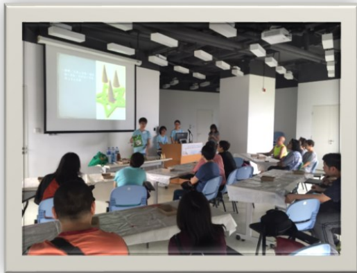
5/12 參觀氣候博物館 當日我們學習製作蚊香