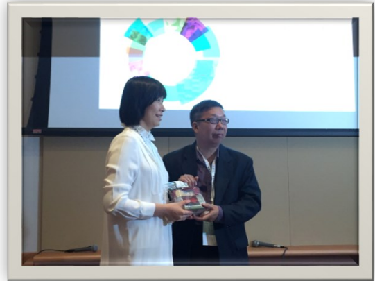
5/10 商界顯關懷活動-故事分享會