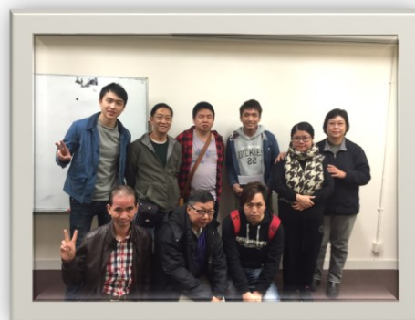
2016/11/26 明愛樂華宿舍探訪